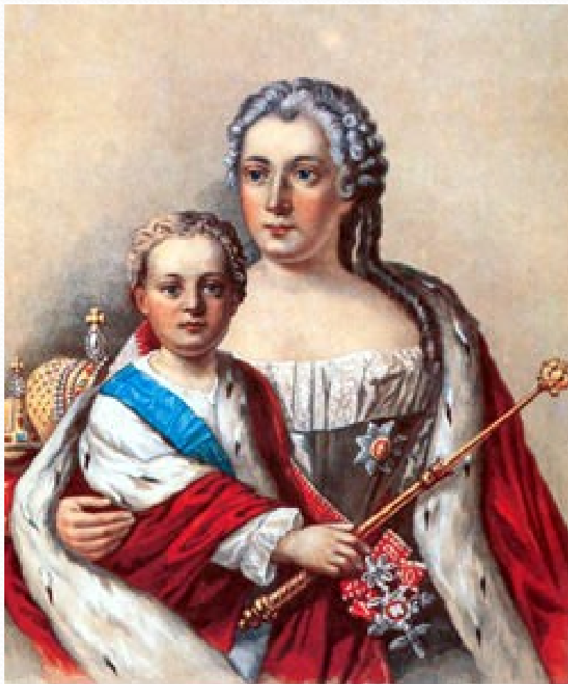
Иоанн VI Антонович (1740-1764)

Незадолго до смерти Анна Ивановна объявила наследником престола Ивана Антоновича, сына своей племянницы Анны Леопольдовны, а регентом со всей полнотой власти - Бирона. Однако Бирон недолго оставался у власти. Прошло менее месяца после смерти Анны Иоанновны. Гвардия свергла ненавистного правителя. Регентшей объявляется Анна Леопольдовна, однако у власти оставаться ей суждено было не более года.