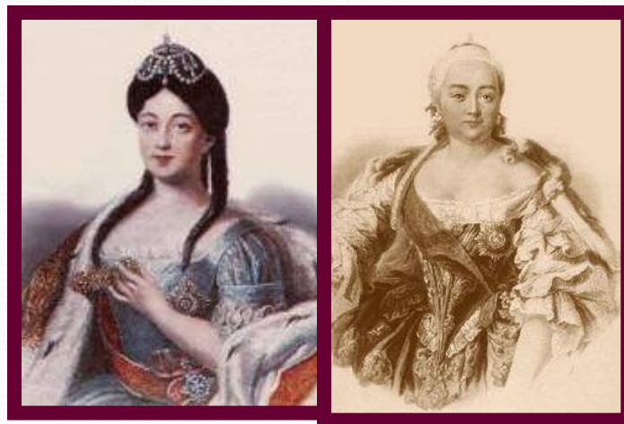
Анна и Елизавета Дочери Петра I