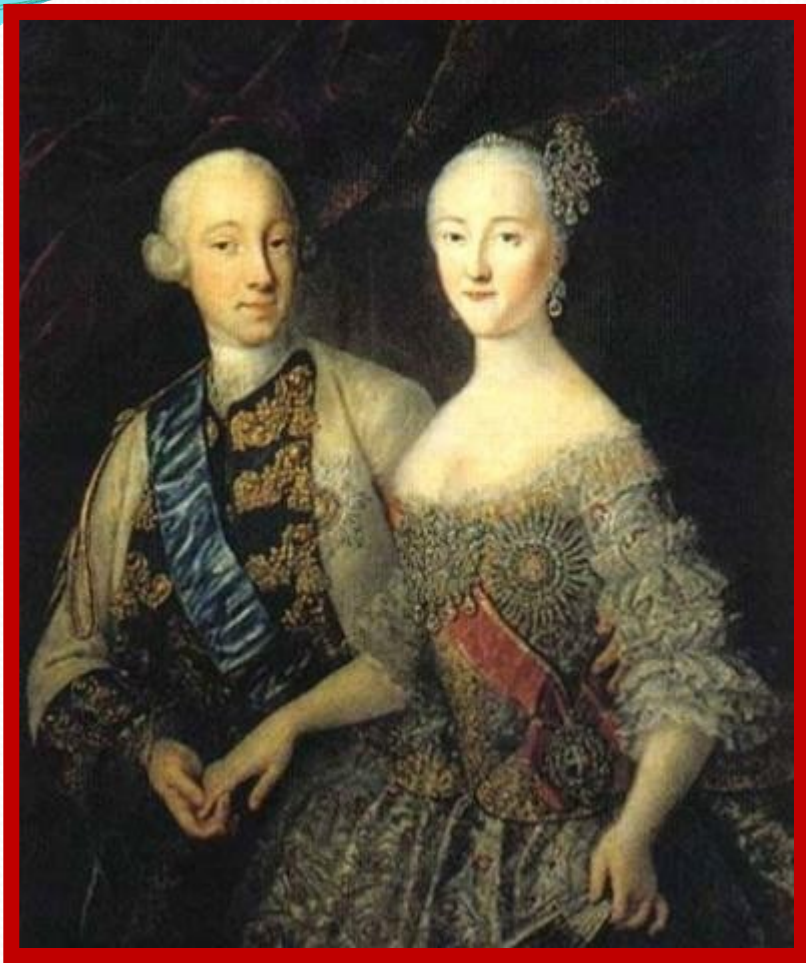
Петр Федорович, великий князь, Екатерина Алексеевна, великая княгиня.