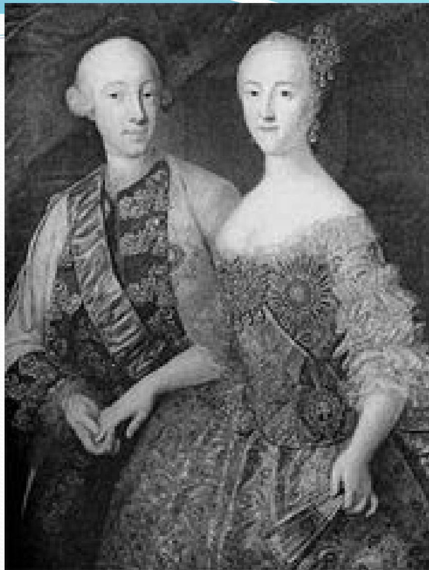
Пётр и Екатерина: совместный портрет