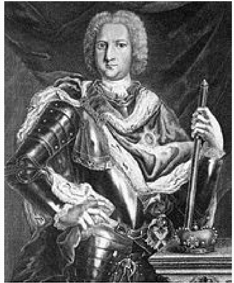
И.С.Сokolov. Портрет герцога Э.И.Бирона.