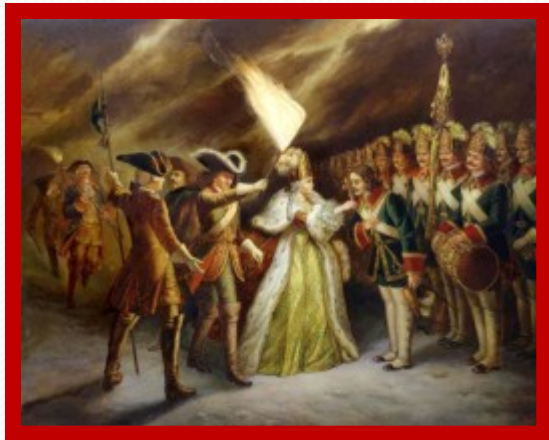
Филипп М.Р. Присяга преображенцев дочери Петра Великого.