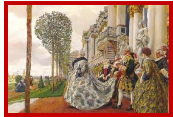
Императрица Елизавета Петровна в Царском Селе Е. Е. Лансере