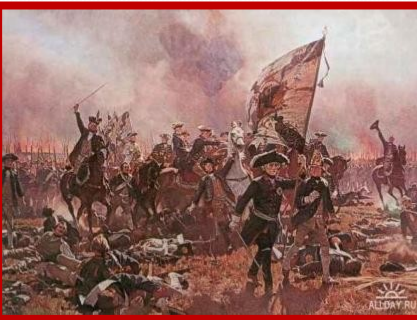
Сражение у Цорндорфа