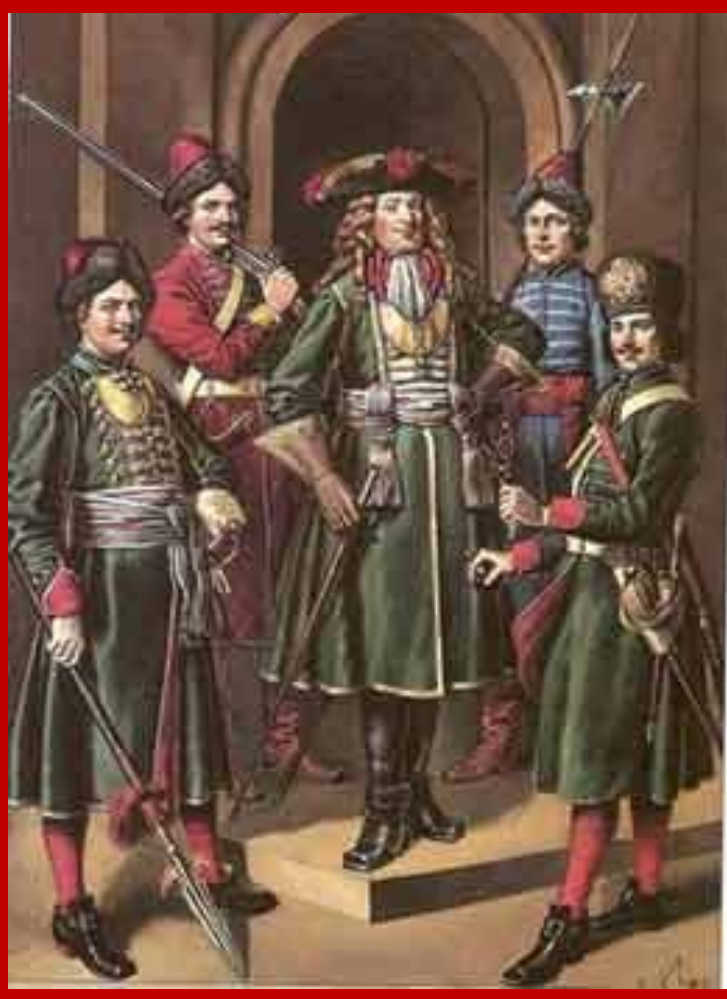
С. Летин "Служилое платье от Петра Великого. Гвардейские мундиры