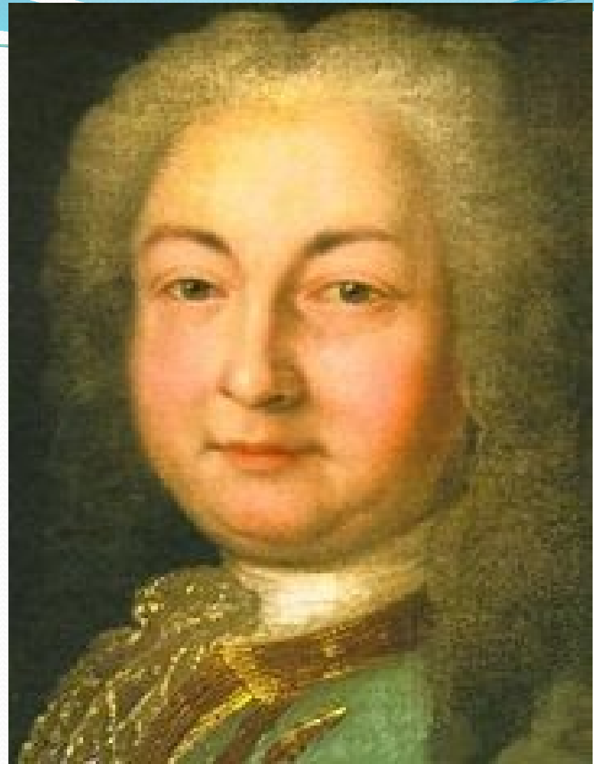
А. И. Остерман.

А. И. Остерман, сделавшись воспитателем и наставником юного царя, старался выполнять свою работу самым добросовестным образом. Однако, несмотря на все свои старания, Остерман так и не сумел оказать должного влияния на мальчика-самодержца.