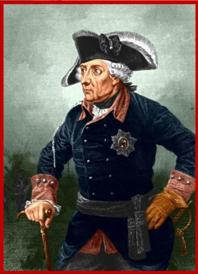
Прусский король Фридрих II

24 апреля 1762 года - Петербургский мирный договор между Россией и Пруссией, заключённый Петром III, поклонником Фридриха II Прусского. • Россия выходила из Семилетней войны и добровольно возвращала Пруссии территорию, занятую русскими войсками, включая Восточную Пруссию.