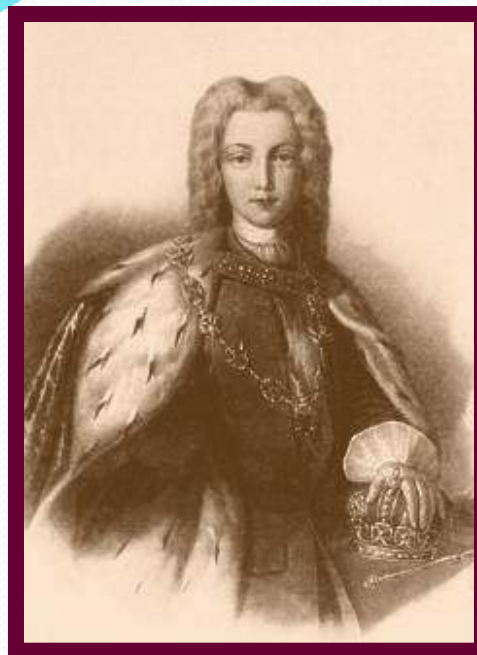
Петр (сын царевича Алексея)