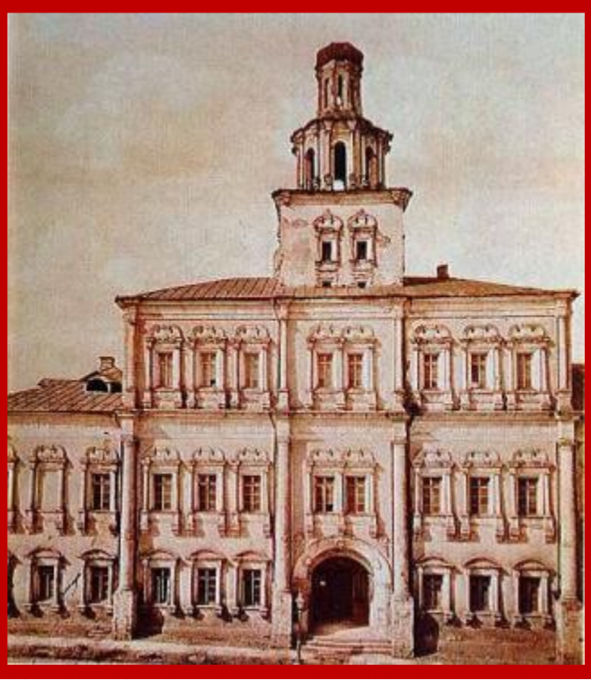
Первое здание Московского университета