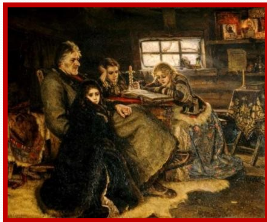
Суриков В.И. Меньшиков в Березове.